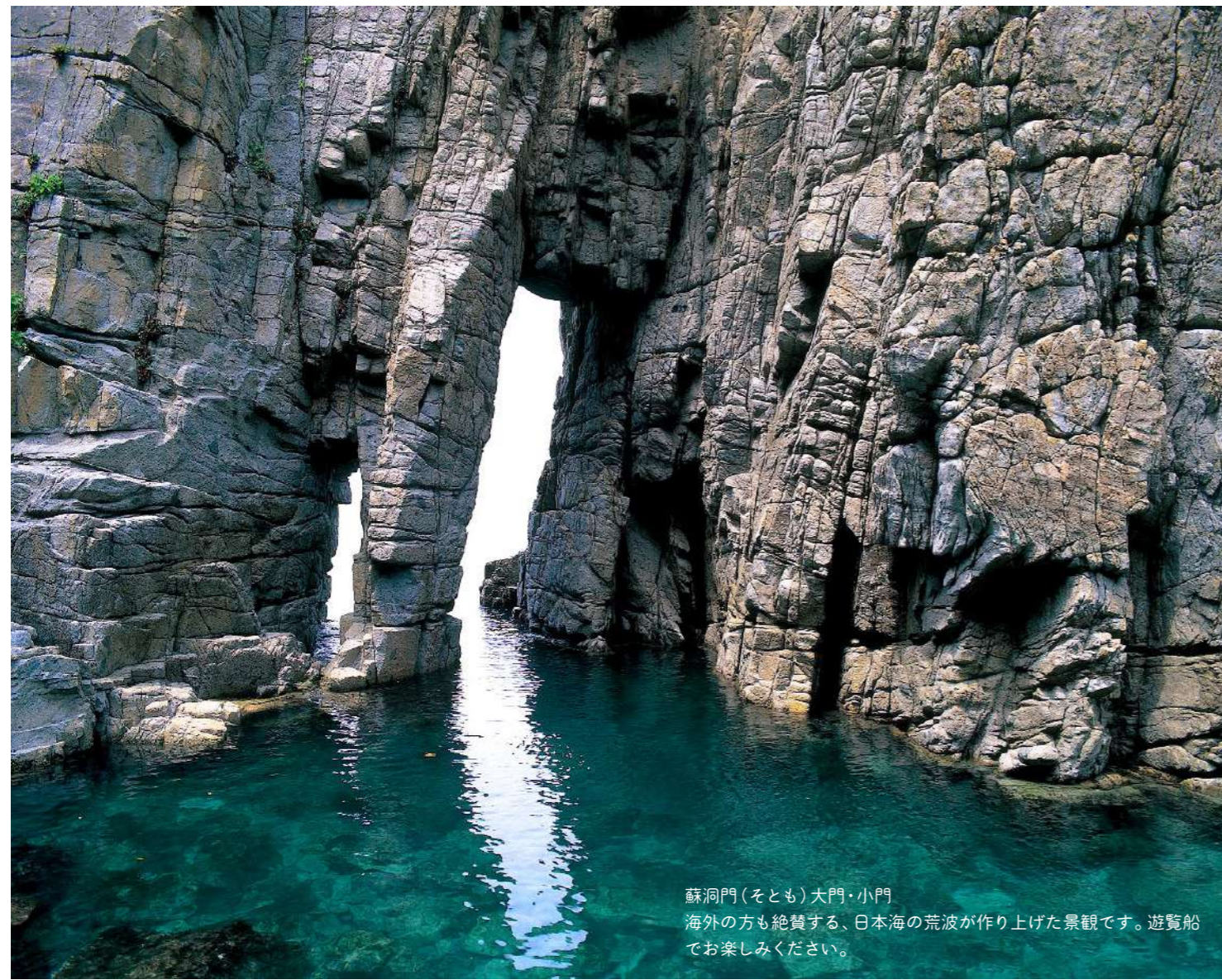
蘇洞門(そも)大門・小門 海外の方も絶賛する、日本海の荒波が作り上げた景観です。遊覧船 で楽しみください。