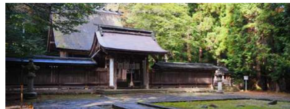
若狭彦神社 上社(若狭彦神社)

1300年余りの歴史を有する、若狭一宮 若狭彦神社。上社と下社に分かれており、共に本殿・神門・随神門は福井県の文化財に指定されています。祭神は、上社は彦火火出見尊(ひこほほでみのみこと・山幸彦)、下社は豊玉姫命(とよたまひめのみこと・乙姫)。お二人は夫婦で、海上安全・安産・育児など多くのご神徳があり、パワースポットとしても人気の神社です。