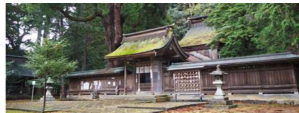
若狭彦神社 下社(若狭姫神社)