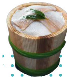
若狭小浜小鯛ささ漬

鯖街道の起点のまちは、鯖の加工が大得意！鯖の胸の太いところがぎゅうぎゅうに詰まってとっても贅沢です。しっかりとした身、とろける脂、小浜の鯖缶にハマる人続出です。