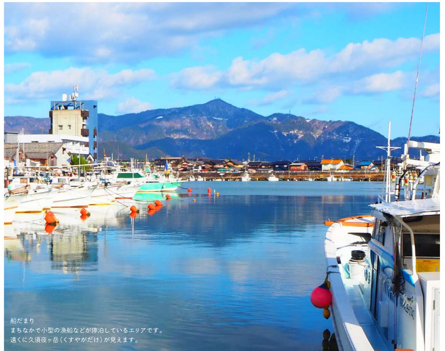
船だまり まちなかで小型の漁船などが停泊しているエリアです。 遠くに久須夜ヶ岳(くすやがだけ)が見えます。

歴史も、食も、文化も、全て海とのつながりがあります。また小浜の海は、たくさんの表情を見せてくれます。 文化の出入口としての海。京の外港として、たくさんの文化の往来がありました。 食と命を育む海。暖流と寒流が沖でぶつかり、豊富な海の幸を育てています。小浜港には様々な種類の魚が水揚げされ、釣りの聖地としても人気です。 そして、遊び場としての海。穏やかな海は、SUP やシーカヤック、海水浴にもってこいです。 あなたの気持ちが晴れる海を見つけてください。