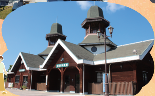
／ JR 若狭本郷駅