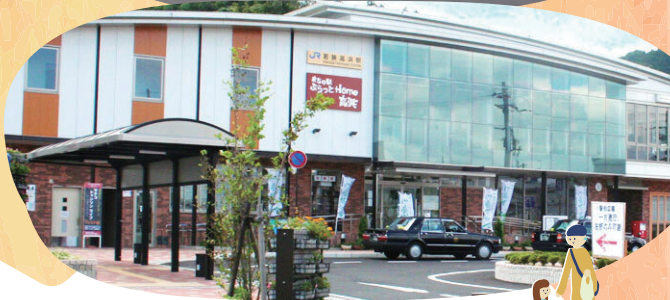
／ JR 若狭高浜駅