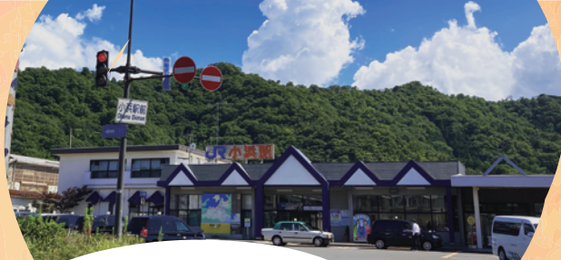
／ JR 小浜駅