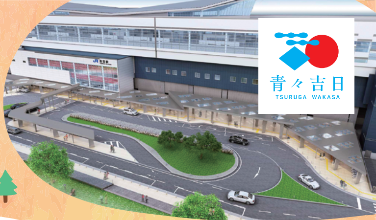
／ JR 敦賀駅