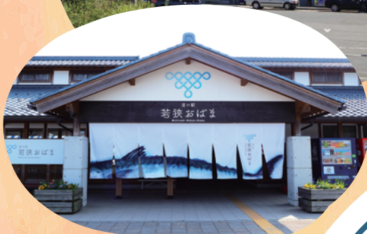
／ 道の駅若狭おばま